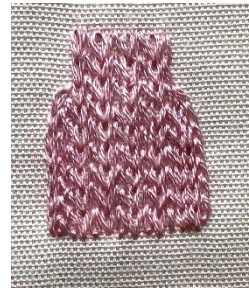
3 cm × 1.4 cm